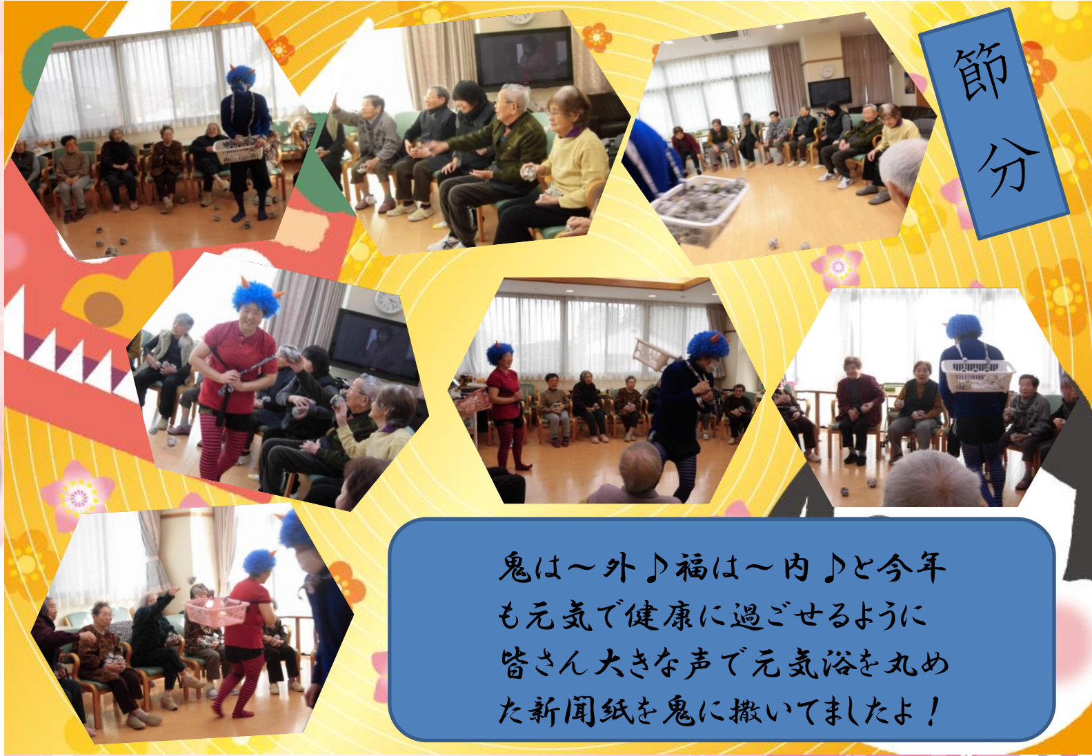
鬼は～外♪福は～内♪と今年も元気で健康に過ごせるように皆さん大きな声で元氣浴を丸めた新聞紙を鬼に撒いてましたよ！