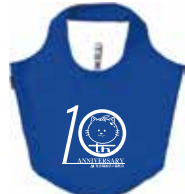
クルリトマルシエバック