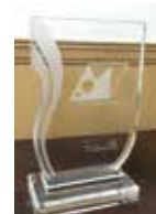
10周年記念アクリル盾