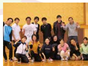
12.3 ミニバレーボール大会