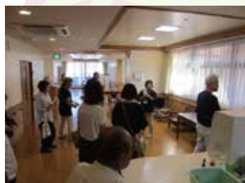
9.16 西海医療福祉センター内覧会