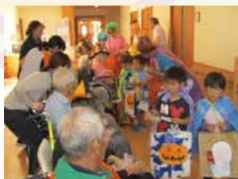
10.31 ハロウィンイベント