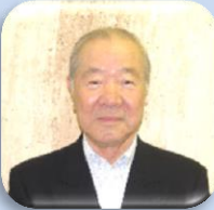
小谷川家族会会長